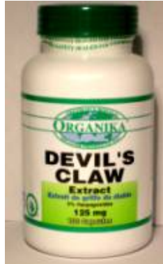
Flacon cu 100 capsule

Devil's Claw de la Organika® este standardizat la minimum 5% harpagoside si este obtinut din plante cultivate ecologic, necontaminate cu metale grele si erbicide.